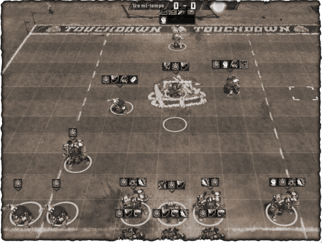
La situation au tour deux : on distingue le lanceur Orque prêt à aller ramasser le ballon au fond du terrain !

Les Orques ne sont pas inquiets, ils savent qu’ils ont une très grosse force de frappe, et se ruent en attaque en préparant une cage ouverte avec les Blitzers Fo4, tandis que l’Orque Noir Fo5 laissé sur la ligne médiane, reste prêt à distribuer des châtaignes. Les Nains continuent de bastonner les gros Orques, mais la ligne tient bon.