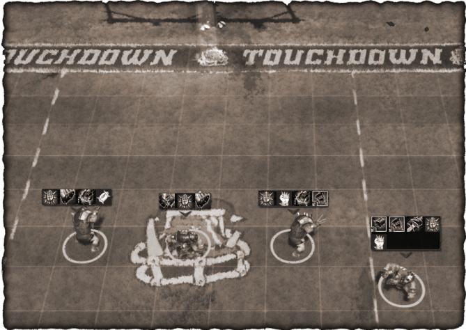
Le lanceur Orque remontant le terrain... sans le ballon ! Il est resté au fond ! Mythique !

Le coach Orque ordonne à son porteur de balle de se mettre en sécurité au milieu de la cage très difficile à bousculer... le public retient son souffle ! Stupeur sur le terrain, alors que l’ensemble des protagonistes s’aperçoit que le lanceur n’a pas ramassé la balle : il est parti à l’attaque sans le ballon – le boulet ! Branle-bas de combat chez les Orques, en renvoyant toute son arrière garde protéger le ballon, plaçant le lanceur près du ballon, collant le centaure avec un trois-quart tacleur.