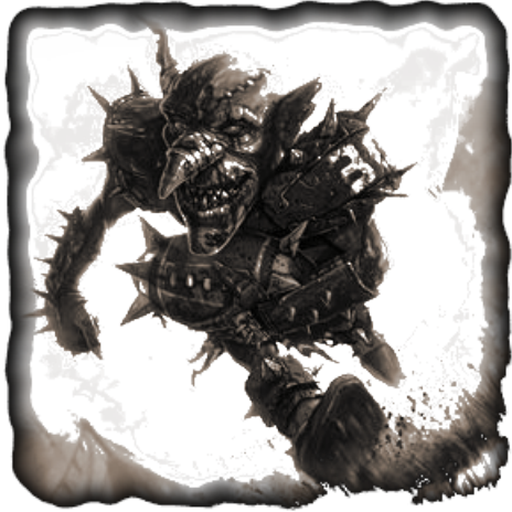
On peut imaginer que les Orques ont entendu causer du pays par le coach...

sans pouvoir protéger le porteur de balle de manière efficace ! En toute fin de mi-temps celui sera couché et les équipes rentreront aux vestiaires sur un magnifique o - o.