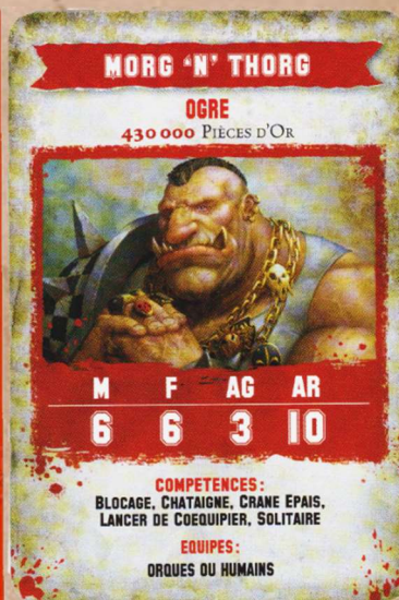
4 e Édition 2016