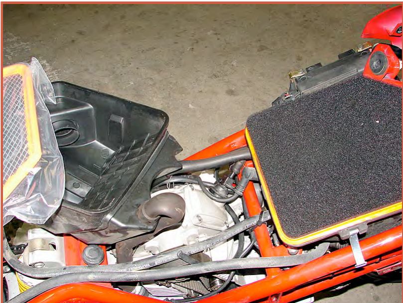
Sur la photo,j'ai laisser le filtre en place et on voit le neuf a coté,la grille est a mettre en dessous,au cas ou vous l'auriez enlever un peu trop vite ;)