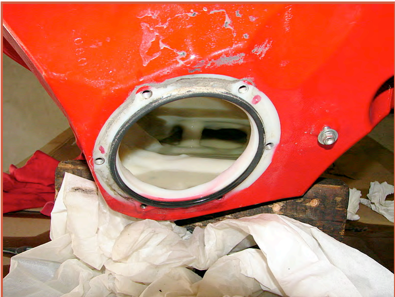
Enlever le filtre,attention il tient par une petite vis et prévoir 2 petits colliers