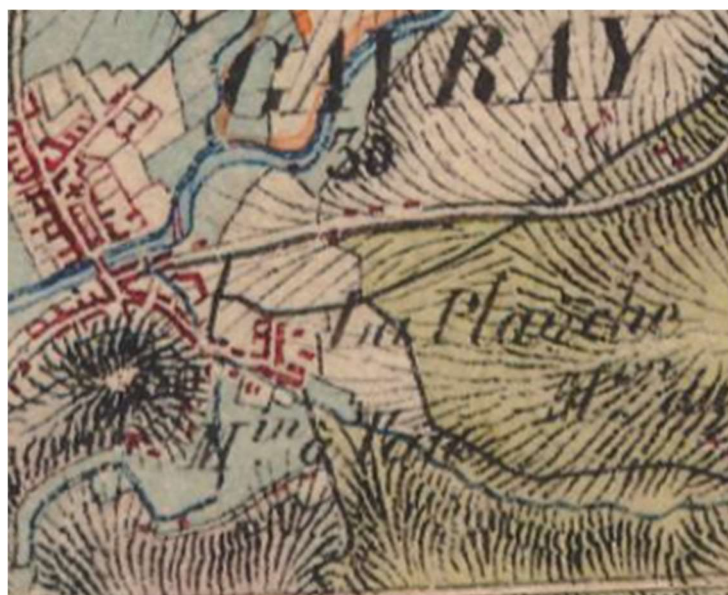
carte de l'état major 1820-1866

vingt-huit janvier mil huit cent quatre-vingt-neuf, transcrit avec l'exploit de dénonciation au même bureau des hypothèques de Coutances, le cinq février