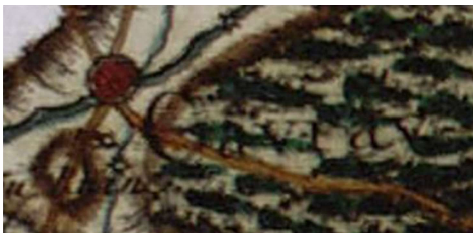
carte de cassini XVIII-ème siècle