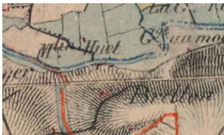
carte de l'état major 1820-1866

... Du dixieme jour de floreal an 4e de la Republique française après-midy devant nous notaire public à la résidence de Hambye, canton de St-Denis-le-Gast,