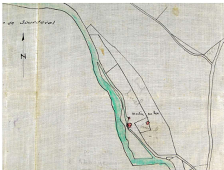
Relevé de propriété en 1929 : 214 J 191 aux archives départementales

Un autre document qui subsiste daté du 22 février 1718 sur les travaux à réaliser à l'abbaye précise « le dit seigneur abbé nous a requis de voir et examiner les réparations nécessaires du moulin banal estant hors les murs de l'abbaye sur le bord de la rivière auxquels lesdits experts ont déclaré qu'il convient y mettre des sablières, chevron, lattes et couverture entière des deux costés, un rouet et un (...) à recevoir la farine et raccommode la roue de dehors, un plancher de bois et une cloison d'argille ».