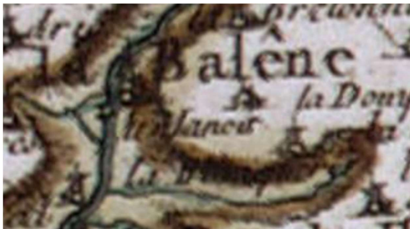
Carte de Cassini XVIII-ème siècle

est le fleuron. C'est donc l'une des zones les plus sensibles et il faut avouer que