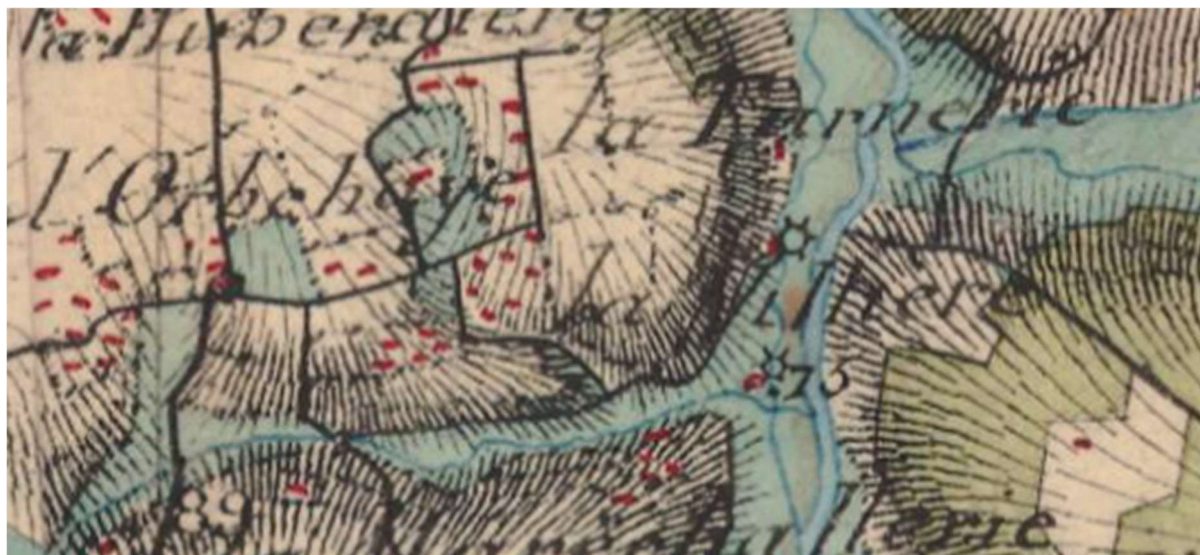
carte de l'éta-major 1820-1866

Téléphone : 02 33 61 45 49 Portable : 06 87 56 35 58 patrimoine.valdesienne@wanadoo.fr