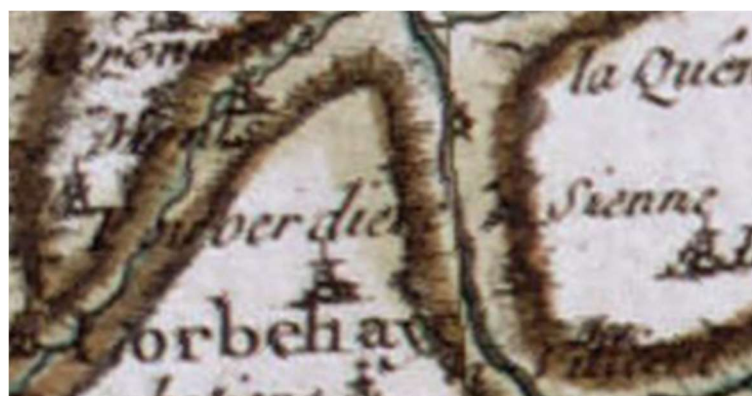
carte de Cassini XVIII-ème siècle

est lézardée et hors de son aplomb, dont il y a environ deux toises de maçonnerie à reconstruire à neuf, en outre quelques autres réparations nécessaires aux autres murs dudit moulin, tant en dedans qu'au dehors. Avons remarqué aussi que la masse de terre et murs d'appui qui