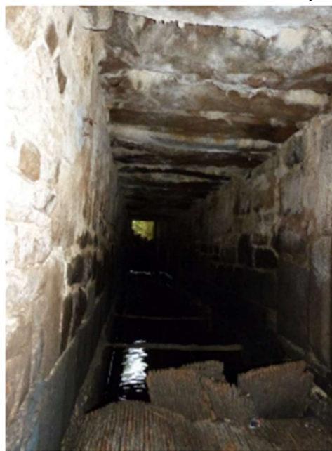
L'entrée de la pêcherie encombrée d'embâcles au bout

rupture du pont en 1891 engendrera un contentieux et une procédure entre les 2 communes pour le financement des travaux. Le Préfet ira jusqu'à exiger la création d'une conférence intercommunale afin de trancher la question. Les financements durent être ajustés en 1893. Le docteur Maurice Lemonnier, médecin et industriel à Villedieu, sera propriétaire du Colombel vers 1913. La notice qui lui est consacrée précise qu'il « consacre ses moments de loisirs à l'usine électrique de Villedieu, qu'il a créée et dont il est le directeur ». Aucune mention n'est faite quant au Colombel. L'île dût ensuite perdre son activité industrielle et décroître. L'intérêt archéologique, historique, est incontestable. Malheureusement, personne ne prit réellement le dossier à bras le corps, notamment pour remettre en place un réseau de chemins sur La Colombe et sur La Bloutière. C'était l'une des idées de base : redonner du sens au patrimoine des deux communes. Il est toujours possible avec de la volonté d'obtenir quelque chose dans l'intérêt général et la qualité de vie des habitants. Nous avons été témoins de la métamorphose du prieuré par la volonté de son propriétaire. Marc nous l'a démontré au cours des visites que nous avons organisées avec l'office de tourisme des métiers d'art de Villedieu. Les prochaines semaines seront sans doute décisives. Un rendez-vous a été demandé à la Fédération de pêche de la Manche et il a été accordé.