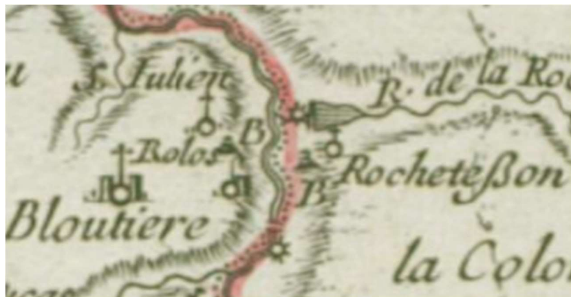
Mariette de la Pagerie 1689

1826 le moulin à Antoine Lemoine. Louis Baudry, docteur en médecine à Villedieu-les-Poêles, inventeur d'un procédé de façonnage de casseroles, sera