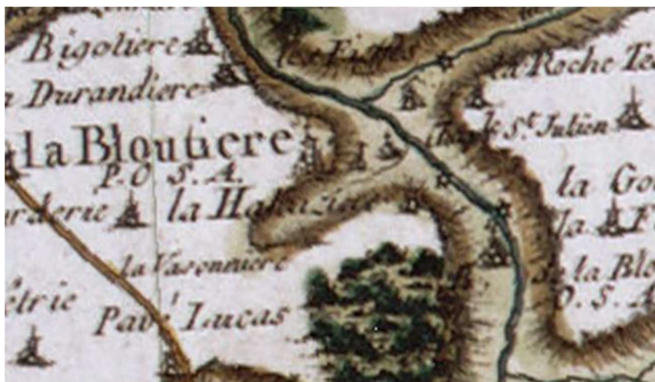
Carte de Cassini XVIII-ème siècle

destination des bâtiments industriels dû évoluer car il est fait mention en 1891 d'une minoterie, propriété de Mr Baudry, située à l'abbaye de la Bloutière. Le pont et l'aqueduc voisin enjambant l'ancien lit du fleuve seront les objets de