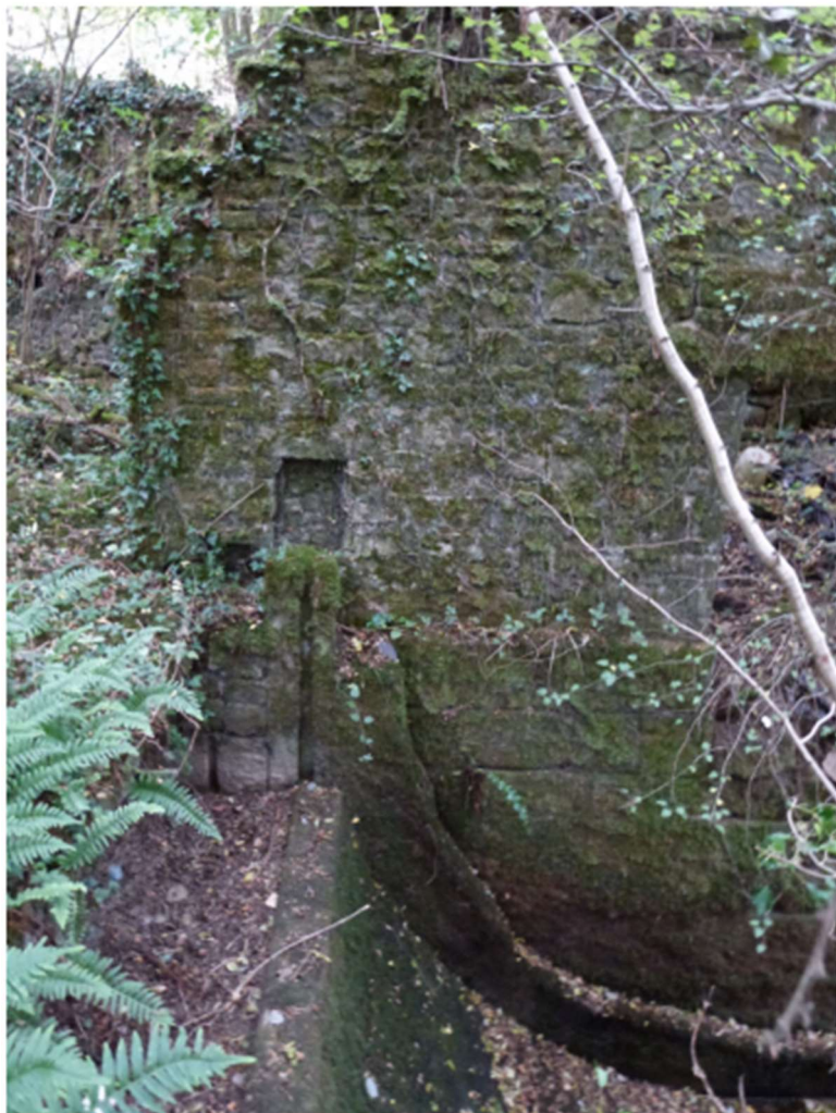
L'un des gabarits de l'énorme roue hydraulique de l'usine à casseroles

plus personne. Le coût des travaux dissuade tout investissement et les normes ne cessent de changer. Que d'argent public a déjà été engagé sur les ouvrages