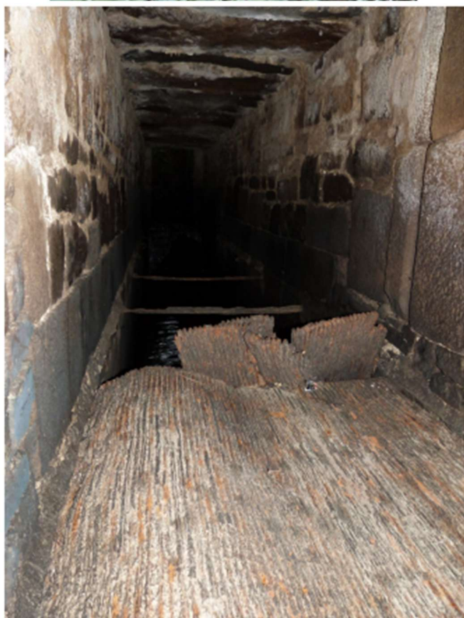
La pêcherie vue ce matin du 14/10/2018

Nous nous étions mobilisés en 2006 autour de cette île artificielle sur le canal d'amenée de la Siennne qui lui sert de lit principal. En effet, à cette époque il était question de travailler aux moyens de remettre la Siennne dans son lit originel. Depuis quand n'y est-elle plus ? Difficile d'y répondre. La carte de Mariette-de-la-Pagerie géographe de l'époque n'est pas suffisamment précise pour qu'on puisse prétendre qu'elle était, à l'époque, dans son lit. L'île du