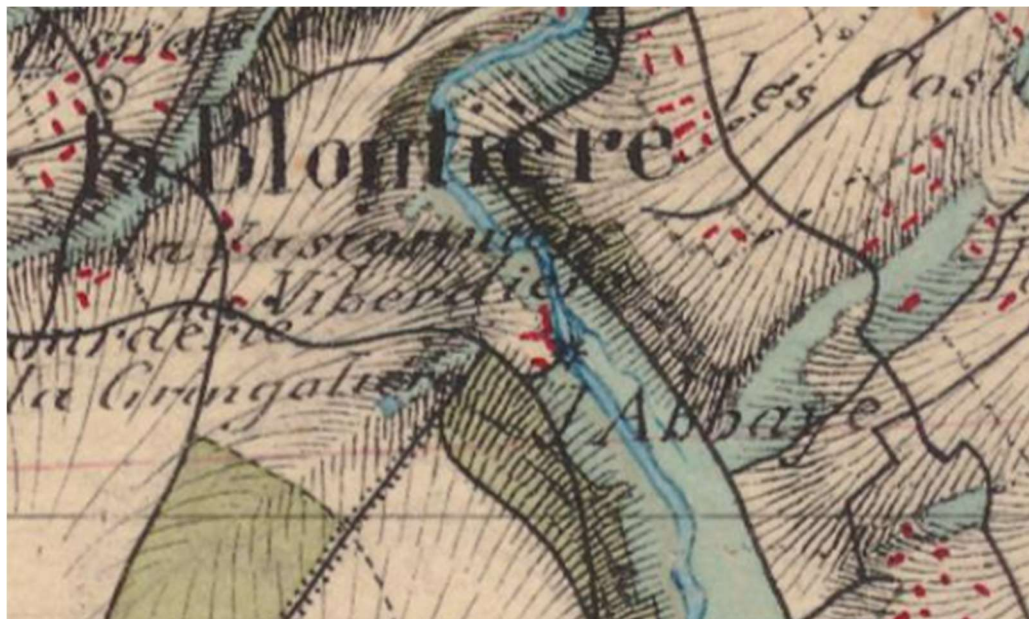
carte de l'état-major 1820-1860

améliorer le débit d'eau et fut jugé conforme. Une échelle à poissons y a été