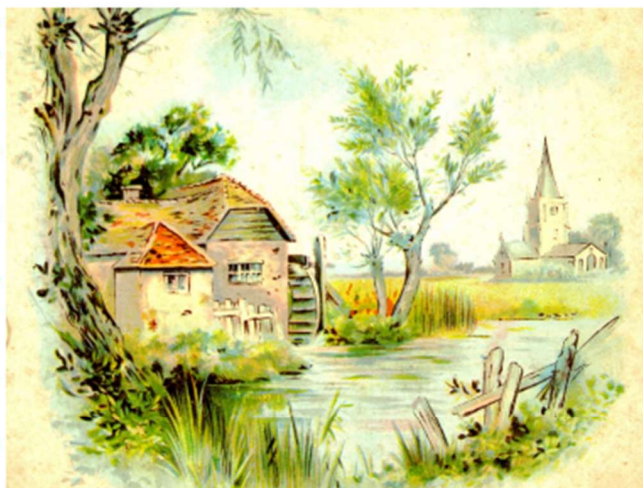
Archives départementales de la Manche

Chérencé-le-Héron, moulin de Belval ou du pont ou du pont Perrin : 1866, 1867, 1884.