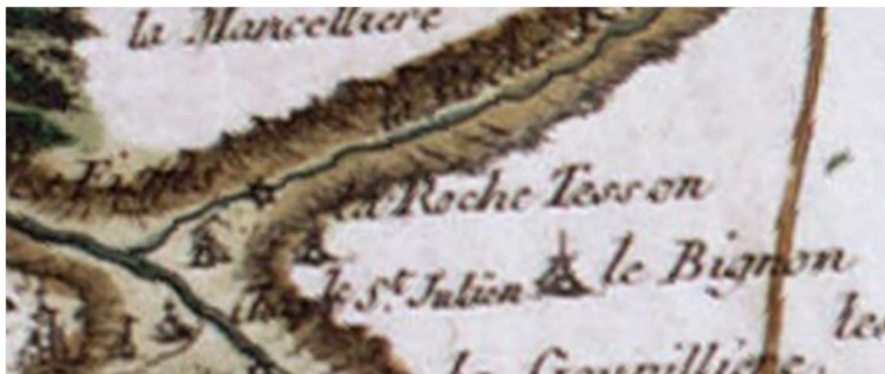
Carte de Cassini XVIII-ème siècle

Percy, proche du moulin de ladicte baronnie de la Ro[ ?] /13 et au dessous de