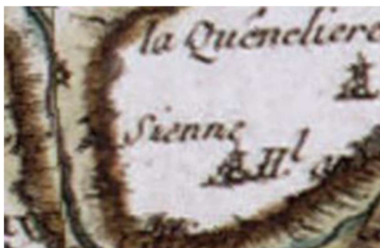
Carte de Cassini XVIII-ème siècle

Le domaine de Sienna (section C 5/2 du cadastre napoléonien) est bien connu pour son ancienne chapelle des roches ou mieux encore des roques, la maison de maître, bâtie au milieu du 19e siècle, l'ancienne laiterie Andro à proximité, l'hippodrome pour l'entraînement des chevaux et les courses hippiques, le bois de Sienna, le culte rendu à saint Mathurin dont une récente statue a pris sa place sur le domaine, l'exploitation agricole biologique et la cueillette des pommes.