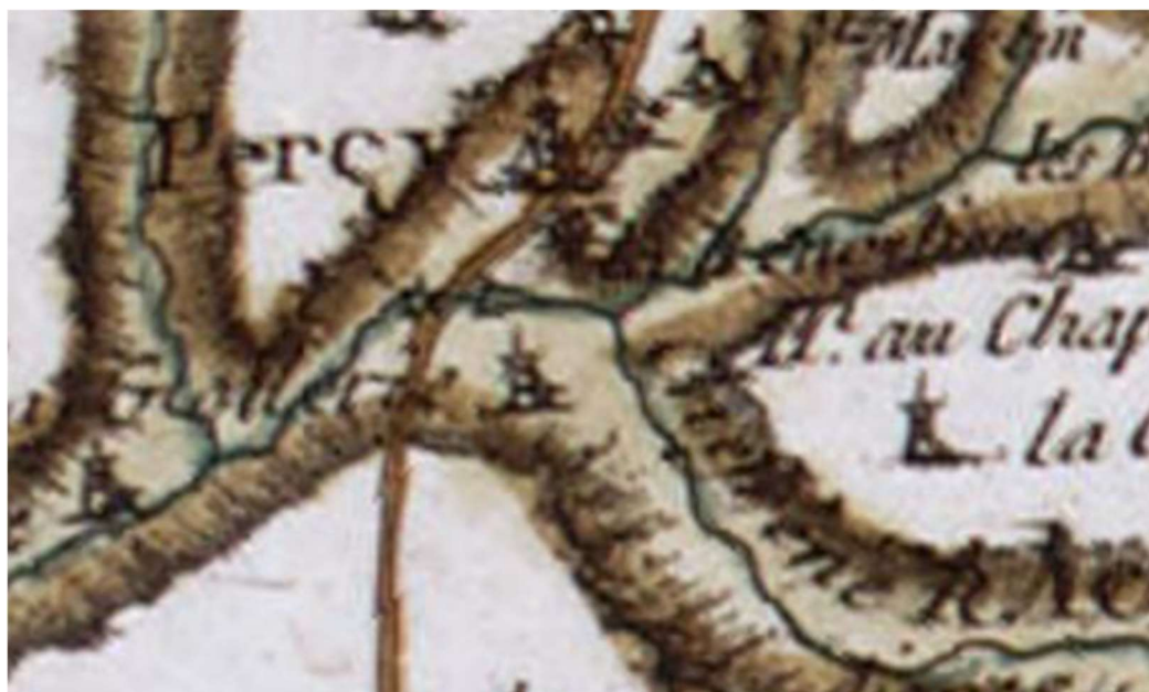
Carte de Cassini XVIII-ème siècle

à 50 hectares 50 ares et 16 centiares. L'acte précise une réserve à propos du moulin « les acquéreurs seront tenus d'indemniser le fermier, à dire d'experts, s'il veut conserver le moulin et ses agrès placés par ce dernier à l'usine de la venderesse et de son consentement ou pourra contraindre le dit fermier à sa sortie à enlever le dit moulin et à rétablir les lieux dans leur ancien état. Si les acquéreurs optent pour la conservation de ce moulin, l'arbre et la roue qui le font mouvoir, ne feront point partie de