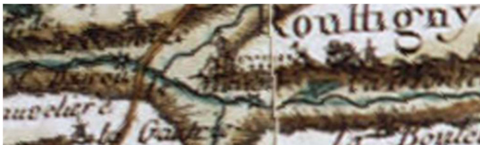
Carte de Cassini XVIII-ème siècle