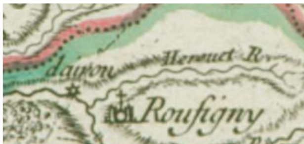
Mariette de la Pagerie 1689

Les premiers documents conservés qui attestent de l'existence du moulin Dérout datent de 1627, 1655 et 1658, par exemple : L'an 1627 le 18 décembre le sieur