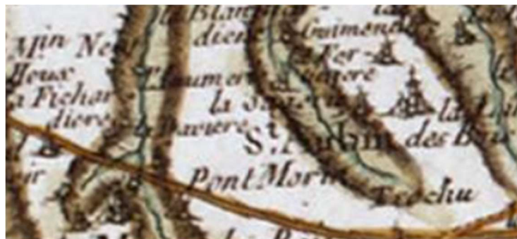
carte de Cassini XVIII-ème siècle

jouissance ainsi qu'à bail de fief appartenant comme du trente novembre dernier avec tous les droits, libertés, eaux, voies et chemins y appartenant à