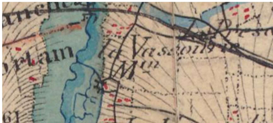
carte de l'état-major 1820-1866