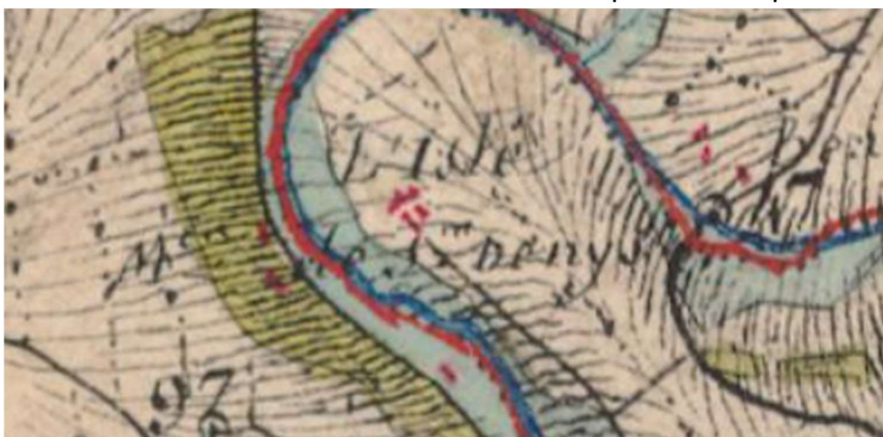
carte de l'état-major 1820-1866

L'affaire se situe sous la Révolution française. Les anciennes paroisses devenues des communes s'organisent pour élire les municipalités. Nous sommes en 1790. Saint-Denis-le-Gast une des fortes communes du canton se prépare à cette élection et le meunier des moulins de l'Angle entre en scène. Voici l'épilogue de cette affaire sous forme de jugement et d'arrangement transcrit par le notaire de Hambye « du vingt-huit mars mil sept cent quatre-vingt -dix, issue des vêpres de Saint-Denis-le-Gast, au pied de la croix étant dans le cimetière dudit lieu, devant nous notaire du roi soussigné comme ainsi fait que le dimanche sept février dernier les sieurs paroissiens dudit Saint-Denis-le-Gast se seroient assemblés dans le chœur de ladite église pour procéder à l'élection d'un maire, d'officiers municipaux et de notables, pour former leur municipalité, on ne put élire que le maire et la suite de l'élection pour les autres membres de ladite municipalité fut renvoyée au lendemain huit et que lesdits paroissiens actifs étant