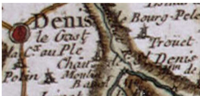
carte de Cassini XVIII-ème siècle

remplir ses fonctions, le nommé Gilles Triquet, meunier des moulins de l'Angle en ladite paroisse de Saint-Denis-le-Gast, s'avisa sur les cinq heures du soir d'attaquer ledit sieur Letouzey et de l'insulter en lui disant qu'il étoit un