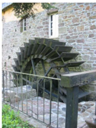
La roue du moulin de Saint-Denis

Téléphone : 02 33 61 45 49 Portable : 06 87 56 35 58 patrimoine.valdesienne@wanadoo.fr