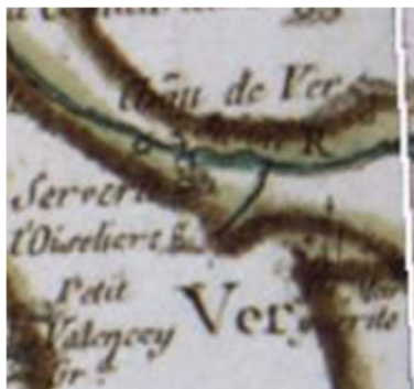
Carte de Cassini XVIII-ème siècle

bien et dument, et dans l'été prochain, sous peine, faute de ce faire, de répondre de tous inconvénients qui en pourraient arriver, sera tenu le dit preneur laisser