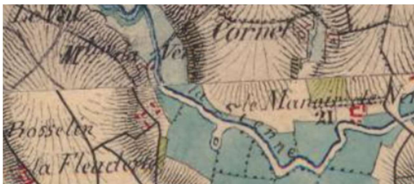
carte de l'état major 1820-1866

les réparations, le dit preneur s'oblige faire ainsi que pour « landoüilloir » ledit seigneur lui fournira les matériaux et bois nécessaires, convenu que faute de