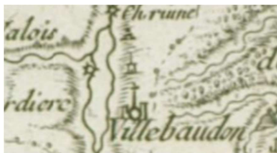
Mariette de la Pagerie 1689

bien difficile d'en retrouver la trace et les vestiges. Ce qui subsiste aujourd'hui n'a plus de point commun, les immeubles et le réseau hydraulique ont disparu. Il subsiste par contre un long canal en ligne droite qu'on qualifierait de fuite. Mais en amont dudit moulin rien de perceptible. Un inventaire après décès des biens de Jules, Alfred Lambert, ancien commerçant, veuf en 1ères noces de