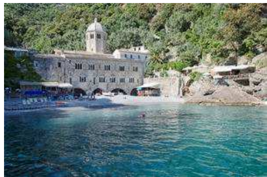
l'abbaye de San Fruttuoso