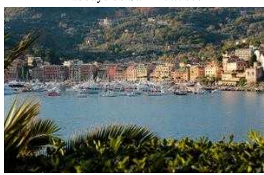
Santa Margherita Ligure