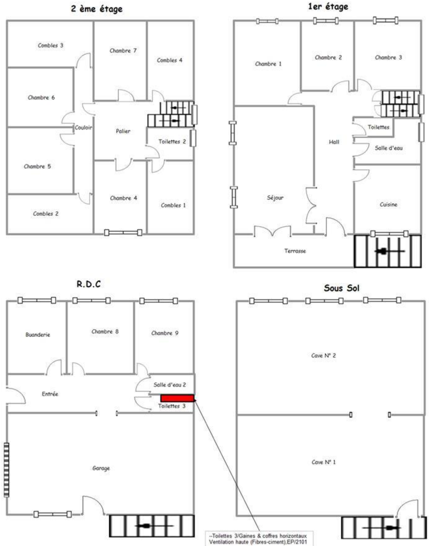
Schéma de repérage