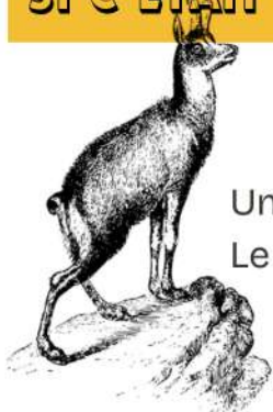
Un gobelin Le Dahu